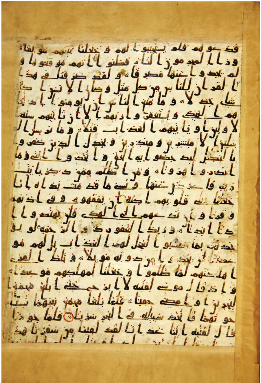
کتابخانه آستان قدس رضوی، مشهد، مصحف مشهد رضوی، بخش اول (= نسخه قرآن ش ۱۸)، برگ A118a