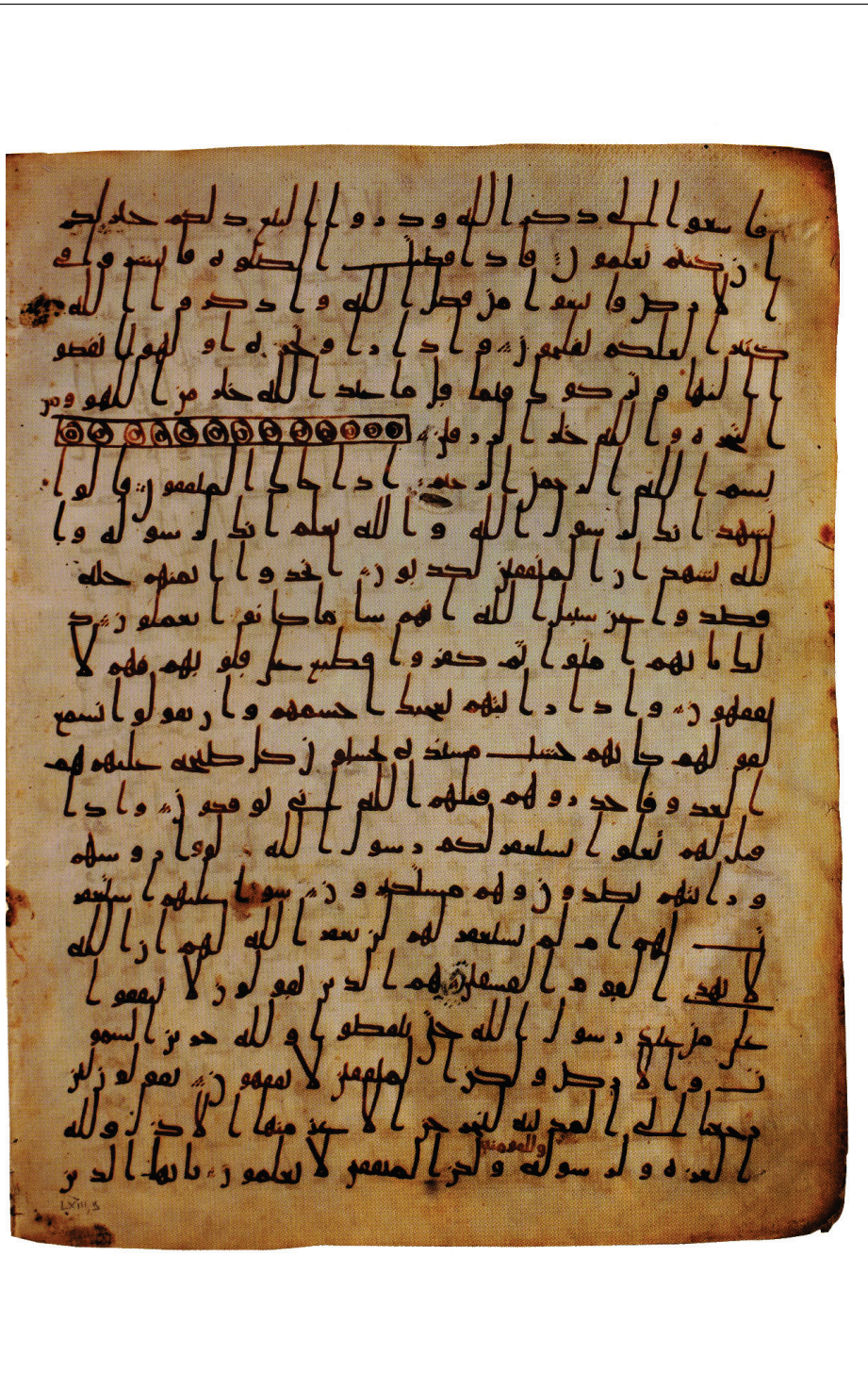
موزه هنرهای ترک و اسلام، استانبول، نسخهٔ E87، برگ ۲ ب

آینه پژوهش ۲۰۳ سال ۳۴، شماره ۵ آذر دی ۱۴۰۲