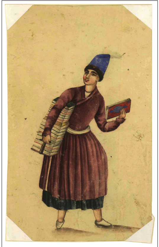
تصویر ۵. کتابفروش جوان دوره‌گرد (کتابخانه مجلس)