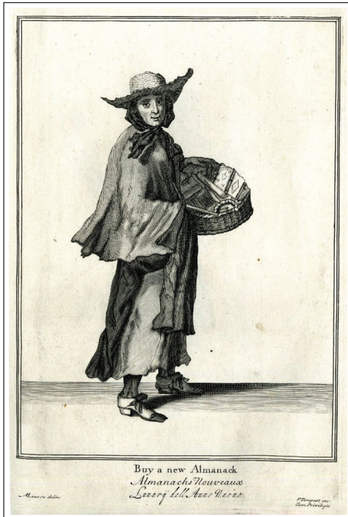
تصویر ۲. کتابفروش دوره‌گرد زن، ۱۶۸۸م.