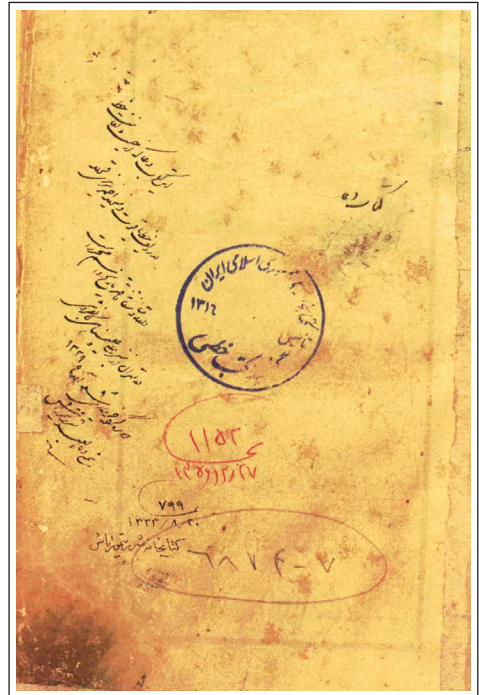
تصویر ۷. یادداشت تملک و خرید نسخه خطی دعا توسط شررتیمورتاش (کتابخانه ملی)