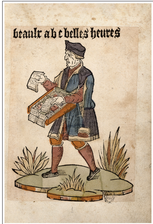
تصویر ۱. کتابفروش دوره‌گرد، قرن ۱۶ میلادی، کتابخانه آرسنال، RES-EST-۲۶۴ (فرانسه)