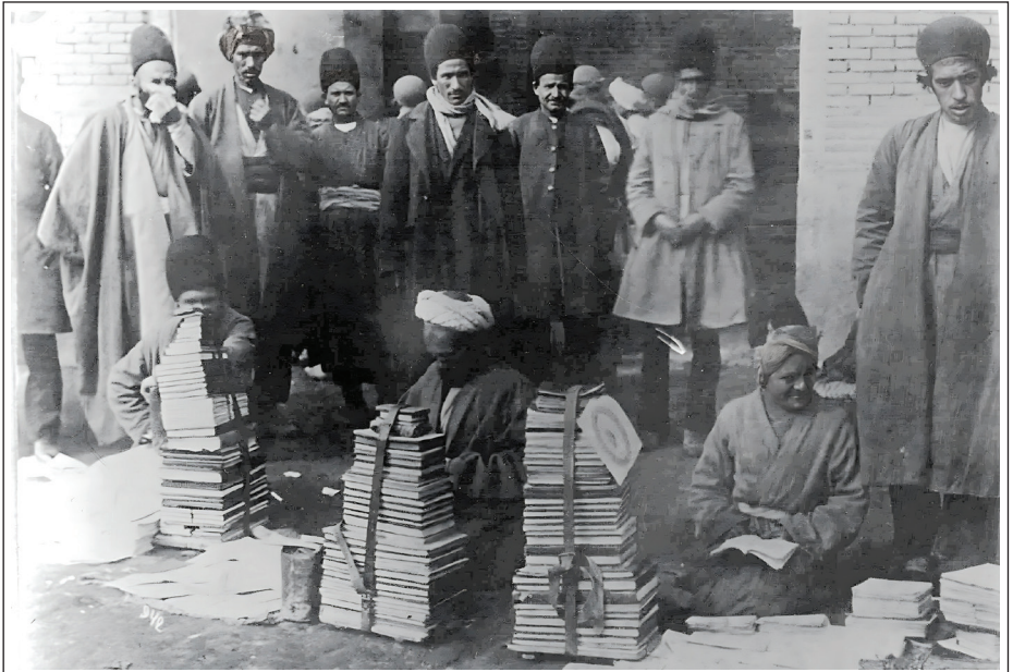
۲۰۳ آینه پژوهش سال ۳۴، شماره ۵ آذر و دی ۱۴۰۲