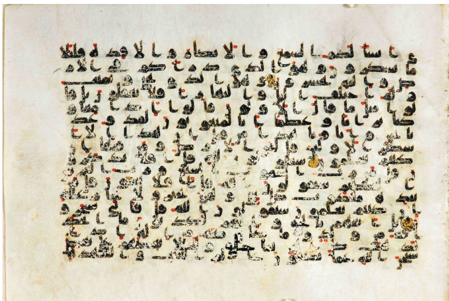
تصویر ۱۵: نمونه‌ای از اختلاف قرائات و اختلاف مصاحف الامصار در مصحف نجف: «سيقولون الله» در آیات مؤمنون، ۸۷ و ۸۹