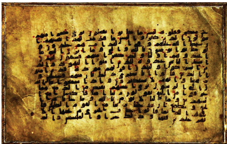
تصویر ۸: برگه از قرآن منسوب به خط امام زین العابدین علیه السلام در موزه آثار فرهنگی و نسخ خطی دکتر محمدصادق محفوظی (تهران)