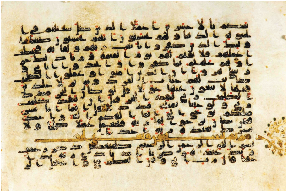
تصویر ۱۱: نمونه تذهیب موجود در حاشیه سرآغاز سوره مریم، در مصحف نجف ص ۳۰۸؛ برگه ۱۵۴ پشت