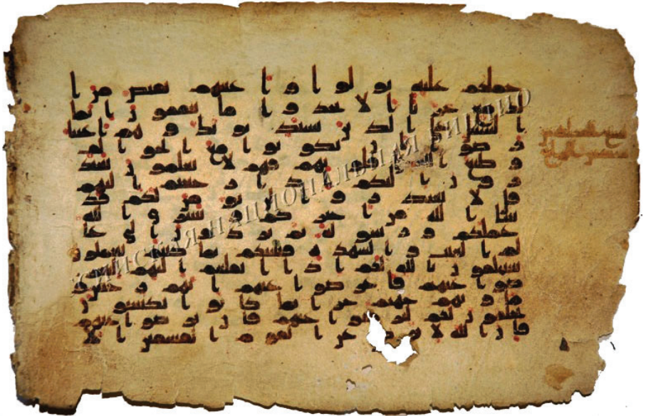
تصویر ۹: نسخه ۱۰۱ Marcel در کتابخانه ملی روسیه (سن پترزبورگ)