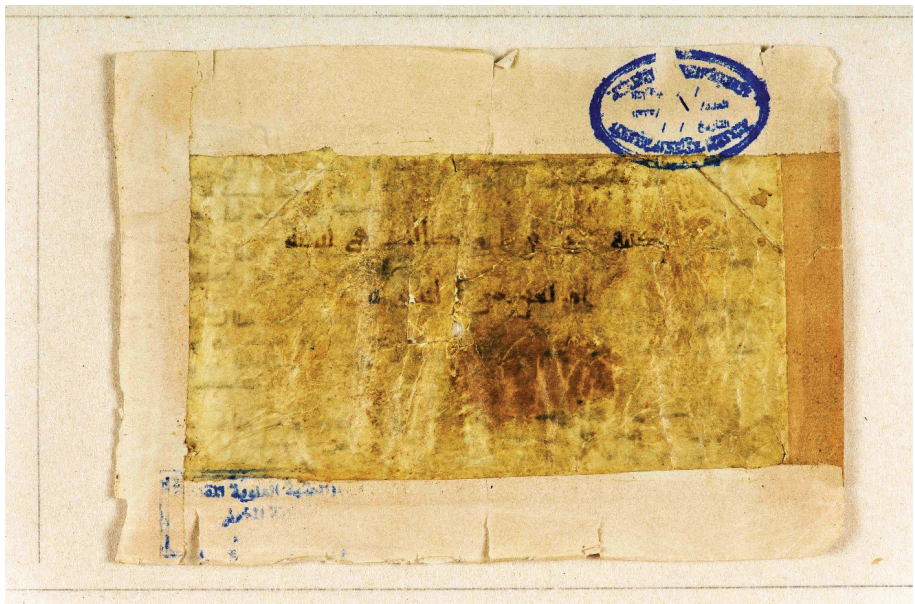
تصویر ۲: رقم الحاقی در آخرین صفحه مصحف نجف: «کتبه علی بن ابی طالب فی سنة أربعین من الهجرة»