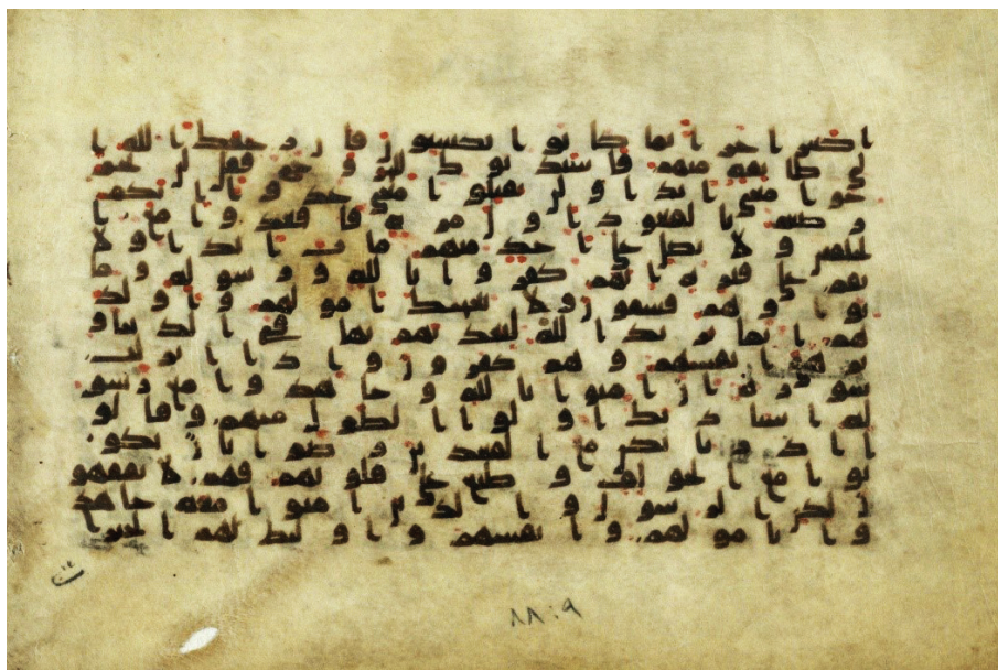
تصویر ۷: نسخه Yahuda Ms.Ar.972 در کتابخانه ملی اسرائیل (بیت المقدس)