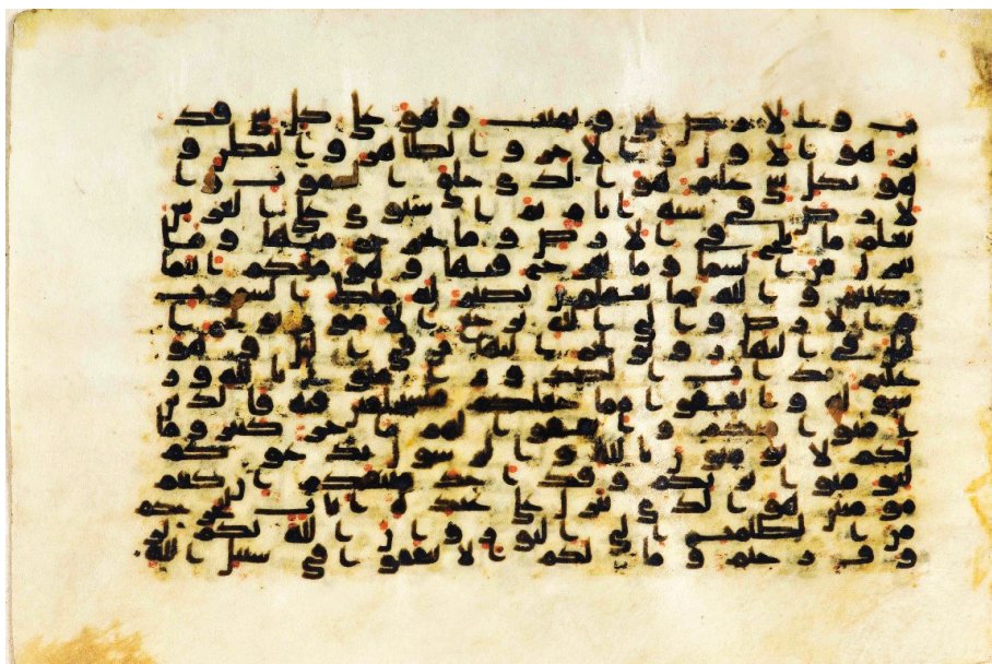
تصویر ۱۶: نمونه از سهو کاتب در مصحف نجف: جا افتادن کلمه «بینات» (حدید، ۹) در ص ۵۴۵، سطر ۱۵