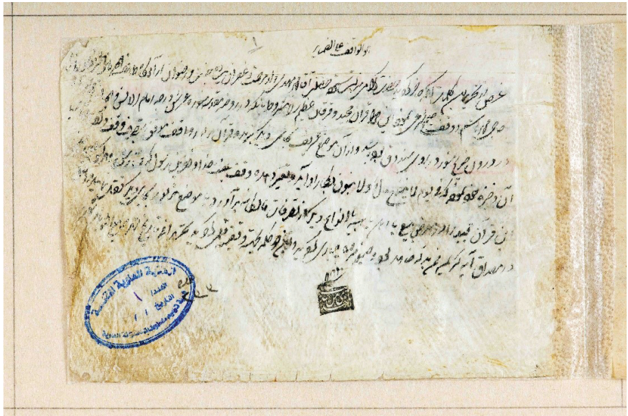
تصویر ۱: وقف نامه آغازین در برگ نخست مصحف نجف، در سال ۱۱۸۹ ق