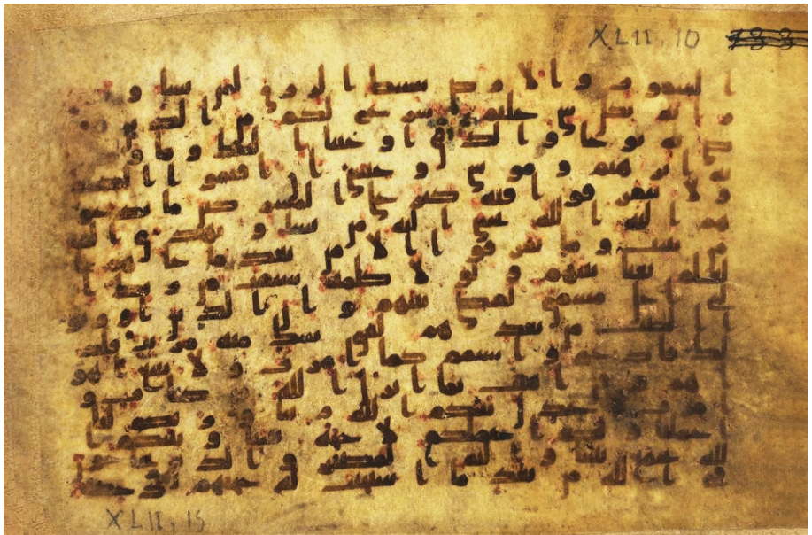
تصویر ۶: نسخه (Arabe 5103(b) در کتابخانه ملی فرانسه (پاریس)