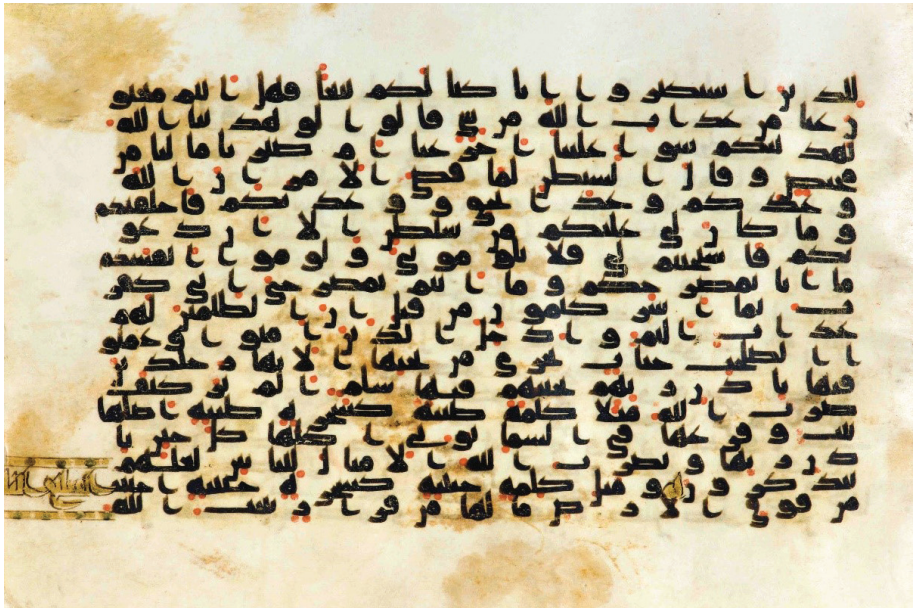
تصویر ۱۳: انتهای شُبع سوم در مصحف نجف در ص ۲۶۱ نسخه