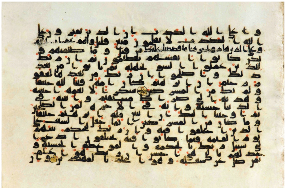
تصویر ۱۴: نمونه‌ای از اوراق مصحف نجف، صفحه ۲۸۳، همراه با اصلاح متن در سطر سوم