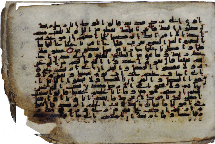
تصویر ۴: نسخه شماره 6814 Or. در کتابخانه دانشگاه لایپن