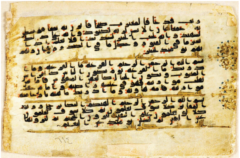
تصویر ۱۲: نمونه تذهیب موجود در حاشیه سرآغاز دو سوره قارعة و تکوین، در مصحف نجف ص ۶۱۴، برگه ۳۰۷ پشت