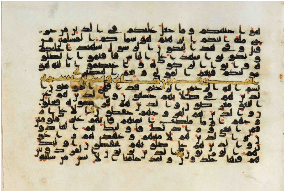
تصویر ۳: تصویری از آغاز سوره مؤمنون در «مصحف نجف» در کتابخانه حرم امام علی علیه السلام