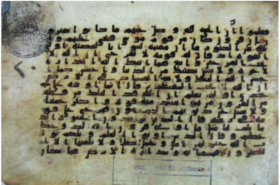
تصویر ۵: نسخه شماره ۲۰ در کتابخانه فاتح (استانبول)