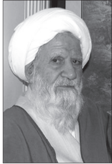
آیت الله صابری همدانی