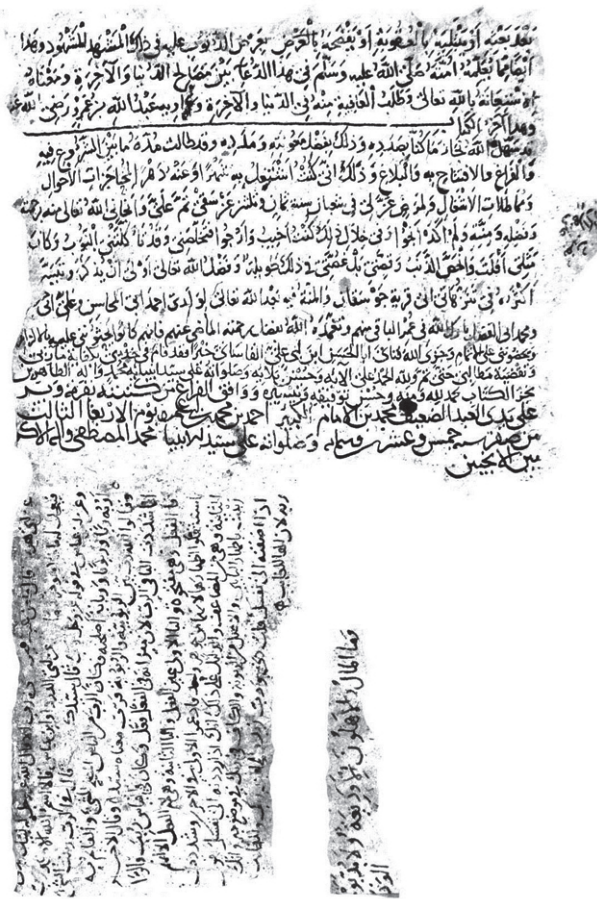
▲ انجام نسخه ضوء الشهاب از کتابخانه متحف عراقی