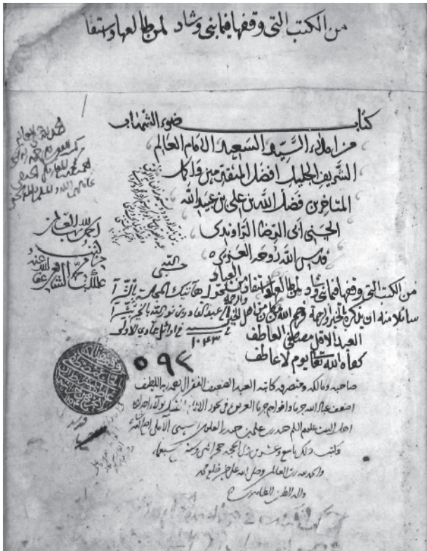
برگ اول نسخه ضوئ الشهبان از کتابخانه عاطف افندی ▲

از آثار او که سرشار از پژوهش و لطائف است، کتاب ضوئ الشهبان است. راوندی این کتاب را در ۵۳۶ هـ در دو جزء برای «الصدر الاجل العالم بهاء الدین جمال الاسلام سید العراقین ابو عبد الله الفضل بن محمد بن الفضل» تألیف کرده است. بنا به تصریح راوندی فضل بن محمد، این درخواست را در خواتم‌های برای وی املا کرده است. او نوشته است: