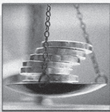
نگارنده، حسین حلبیان