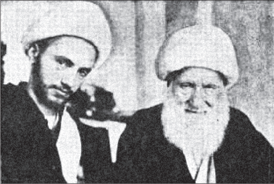
آیت‌الله علی‌اکبر نهایندی و فرزندش شیخ محمد نهایندی